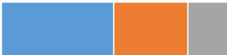
FI - javno naročilo