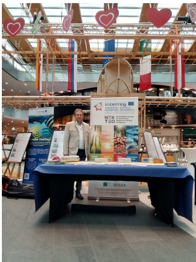
Slika / Bild 8, 9, 10

Die Stadt Klagenfurt, Partner des NEKTEO Projekts, präsentierte das NEKTEO Projekt am Europatag 2019 in Villach im Mai 2019 auf interessante Weise.