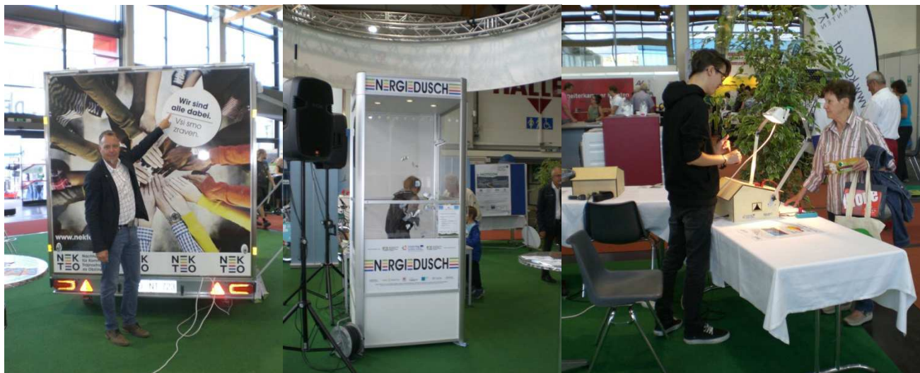
Slika / Bild 21: Utrinki iz sejma Herbstmesse 2018 / Eindrücke von der Herbstmesse 2018 / (Avtor / Autor: Christian Goritschnig, Amt der Kärnten Landesregierung, Abt. 8)

Sie sind zur Mitarbeit und Teilnahme eingeladen!