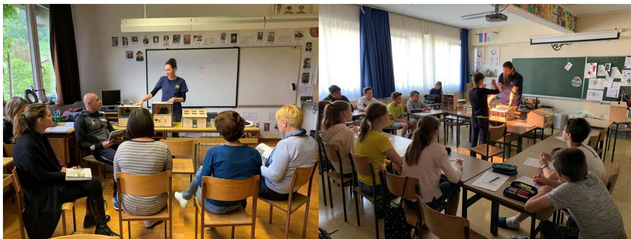
Slika / Bild 5, 6, 7, Avtor / Autor: Ivana Kacafura, GOLEA