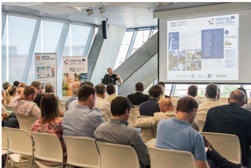
Slika / Bild 15: Predstavitev NEKTEO projekta s strani Deželne vlade A. Koroške, Oddelek 8 in partnerja RA Sora, junij 2019, Ljubljana / Vorstellung des NEKTEO Projekts seitens der Partner: Amt der Kärnten Landesregierung, Abteilung 8 und RA Sora, Juni 2019, Ljubljana

DOGODKI, SREČANJA, JAVNE PREDSTAVITVE, SEJMI, KONFERENCE VERANSTALTUNGEN, SITZUNGEN, ÖFFENTLICHE VORSTELLUNGEN, MESSEN, KONFERENZE