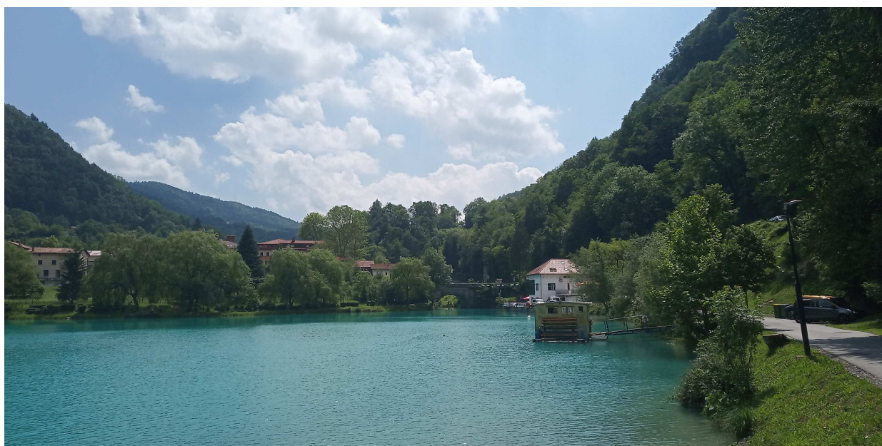
Slika/ Bild 12, 13, 14, Vir / Quelle: GOLEA, Amt der Kärnten Landesregierung, Abteilung 8