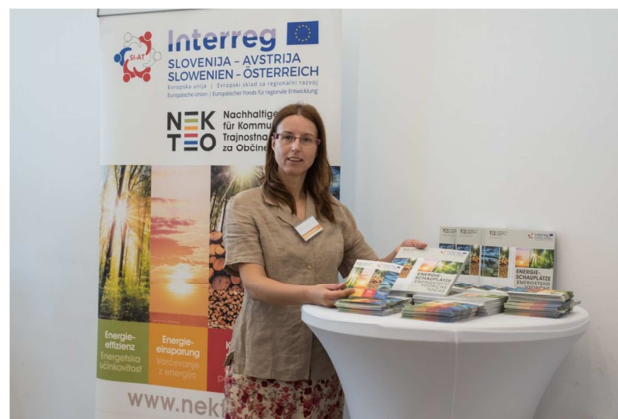
Slika / Bild 16,17,18,19: Utrinki iz dogodka En.občina & En.management 019, kjer se je predstavil NEKTEO projekt, junij 2019, Ljubljana / Eindrücke von der Veranstaltung En.Gemeinde & En.Management 019, Juni 2019, Ljubljana / Avtor / Autor: Katja Cankar