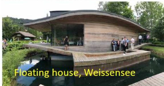
Slika / Bild 4: Utrinki iz ogledov Energetsko vzorčnih točk NEKTEO projekta / Eindrücke von Besichtigungen der NEKTEO Energieschauplätze