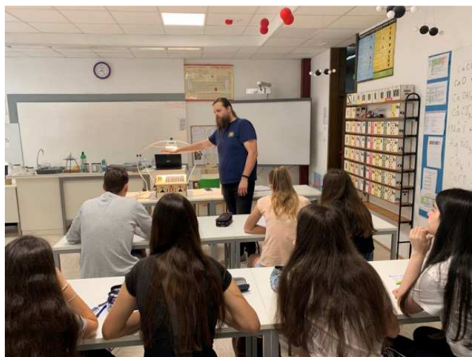
Slika / Bild 20