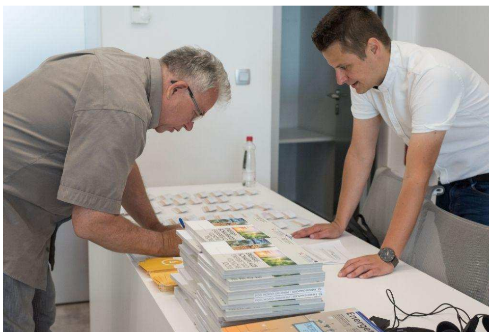
Slika / Bild 1: Utrinki iz dogodka En.občina & En.management 019, kjer se je predstavil NEKTEO projekt, junij 2019, Ljubljana / Eindrücke von der Veranstaltung En.Gemeinde & En.Management 019, Juni 2019, Ljubljana

Besuchen Sie uns 2019 auf Veranstaltungen , um weitere Informationen über NEKTEO Schulungen, Fachexkursionen und andere interessante Veranstaltungen zu erhalten!